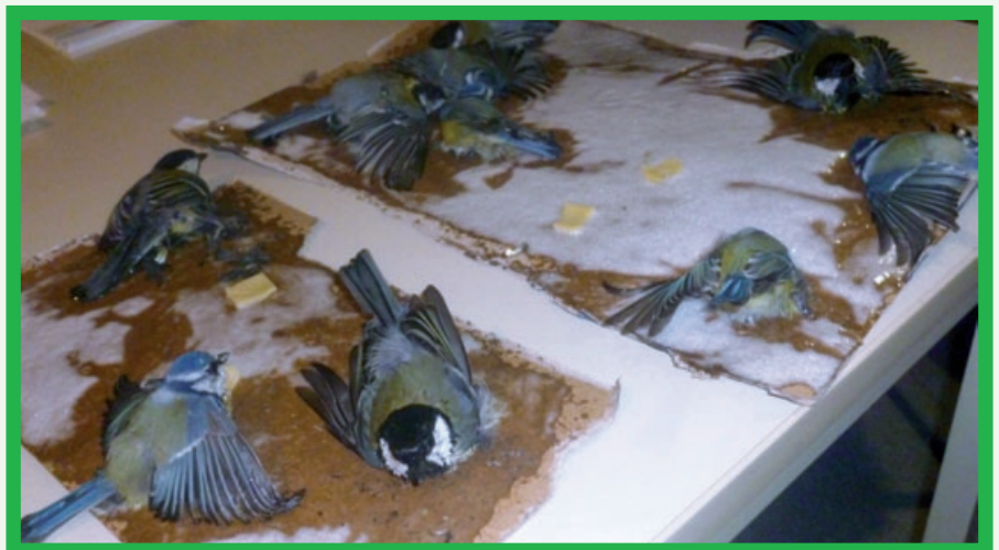
Qualvoller Tod von geisteskranken Tierquälern verursacht

Zunächst unglaublich, aber dennoch leider wahr, ist ein Vorfall in Dormagen-Hackenbroich. Dort wurden in Gebüsch Vogelfallen der besonders grausamen Art gefunden. Mit Klebstoff bestrichene Pappen waren geschützt in den Sträuchern ausgelegt und mit Käseködern bestückt.