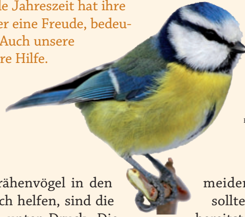
Futterming Meise

Ob nun der Winter oder das Frühjahr – jede Jahreszeit hat ihre guten und schlechten Seiten. Für die Kinder eine Freude, bedeutet Schnee für die Tiere meist bittere Not. Auch unsere heimischen Singvögel benötigen dann unsere Hilfe.