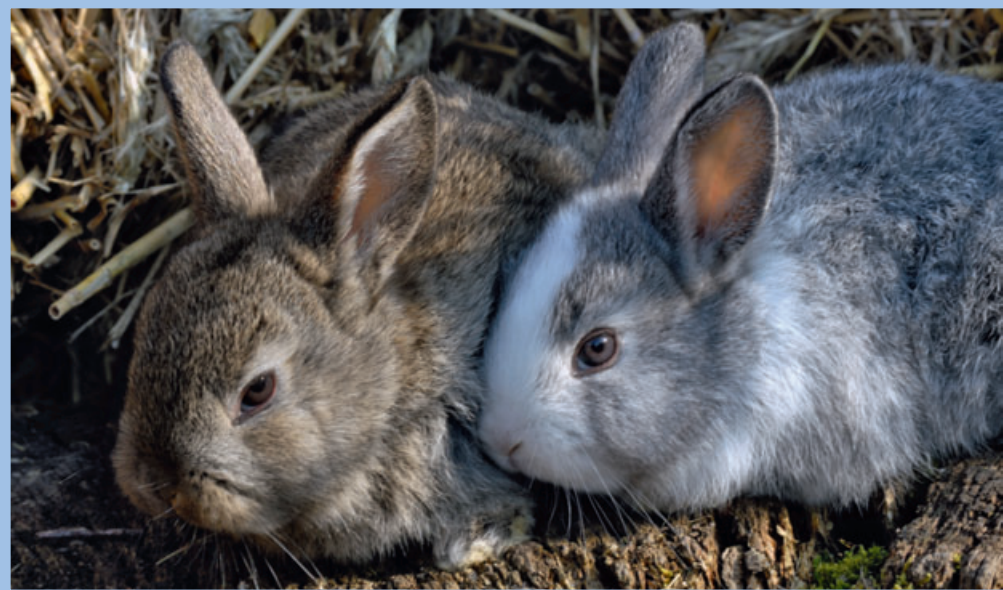
Heute heiß geliebt – morgen abgeschoben. Auch Kaninchen erleiden dieses Schicksal

Gleich am frühen Morgen des 12. Dezember, einem Tag wie jeder andere, werden zwei Kaninchen im Tierheim abgegeben. Eigentlich ist das Heim noch geschlossen, doch die Klingel wird so lange betätigt, bis ein Tierpfleger sie hört und seine Arbeit bei der Tierpflege unterbricht. Die Überbringer am Tor erklären, dass sie die Tiere aus einem Haushalt „rausgeholt“ hätten, in dem die Kaninchen vernachlässigt worden seien. Allerdings habe man feststellen müssen, dass die Pflege doch umfangreicher sei und man diese nicht gewährleisten könne. Konsequenz: Die Tiere müssen ins Tierheim.