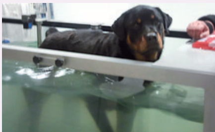
Thyson in der Physiotherapie

In unserer letzten Ausgabe stellten wir Ihnen den Sorgenfall „Thyson“ im Tierheim Oekoven vor. Viele Menschen halfen ihm mit einer Spende, und die erste der drei notwendigen